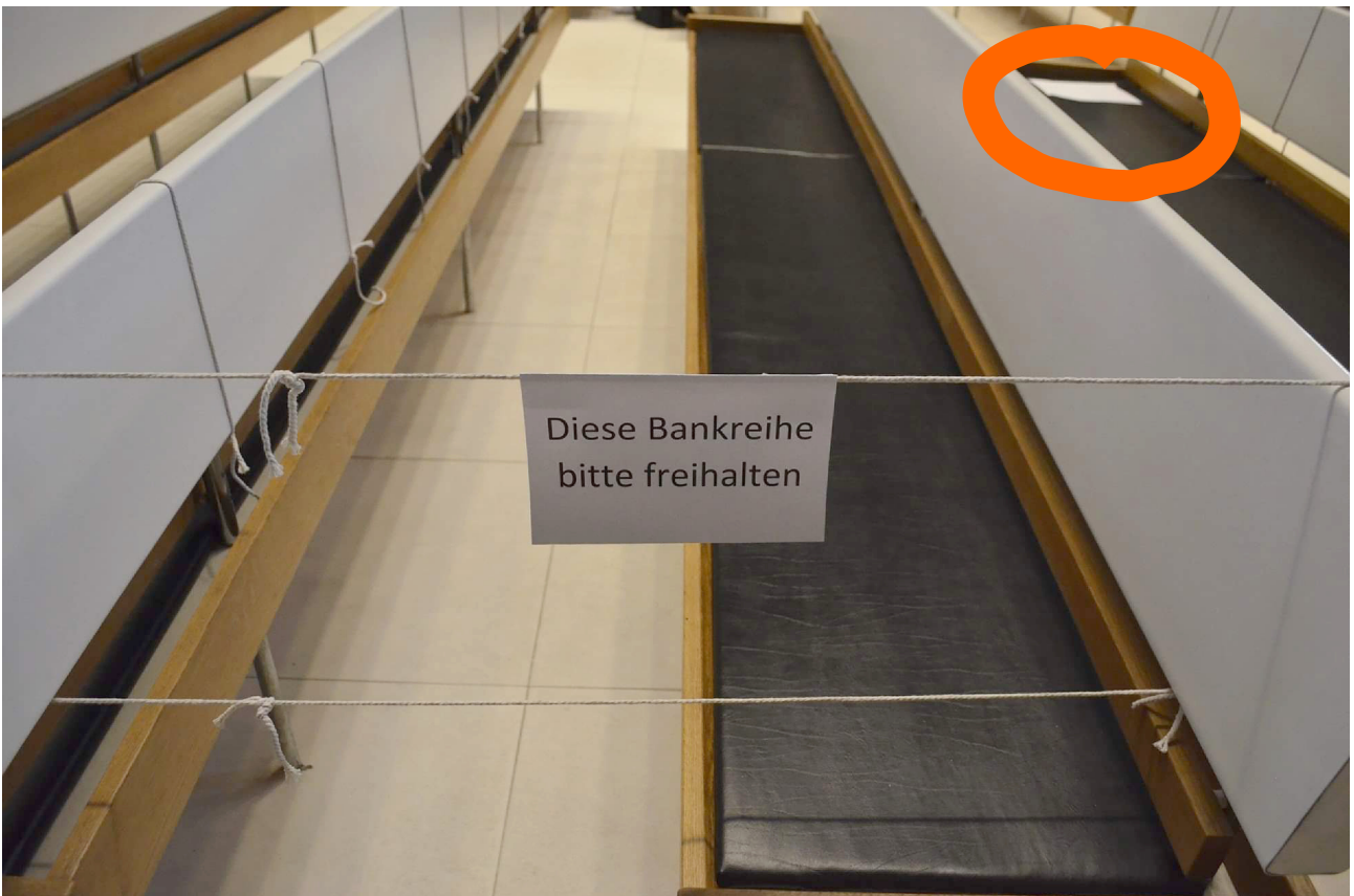
Orange: Kennzeichnung der Sitzplätze mittels ausgelegter Blätter alle zwei Meter.