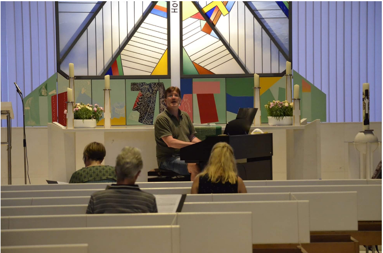
Sitzordnung in St. Lukas – Probe am 23.Juni 2020